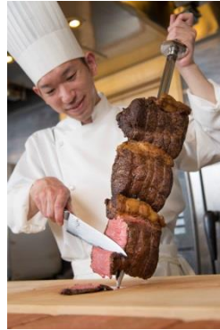
見た目も楽しい 「シュラスコ」 (9・10月ディナー限定)