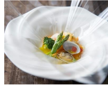
新感覚料理 「カルタファタ包み焼き」 (9・10月ディナー限定)

料金:Lunch 平日 ¥2,600、お子様(4才~小学生) ¥1,300、シニア(65才以上) ¥2,300 ※土・日・祝 ¥3,200 (お子様 ¥1,600) [2部制] Dinner 全日 ¥4,400、お子様(4才~小学生) ¥2,200、シニア(65才以上) ¥3,900