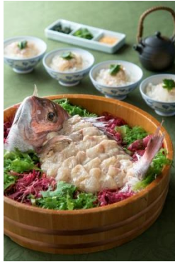
熊野灘で育った「伊勢まだい」 のお茶漬け (9・10月ディナー限定)