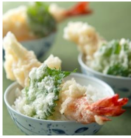
・大海老の天井 (9月月曜ディナー限定)