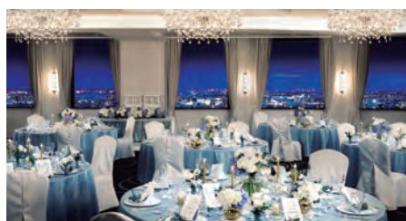
28F スカイバンケット クリスタルルーム